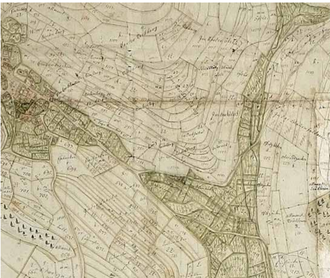
Ausschnitt aus einer Gemarkungskarte von 1780, die einen Eindruck von der Parzellenkleinteiligkeit vermittelt, die mit heutigem Maschinenpark nicht mehr bewirtschaftbar wäre.

6 St. Blasien hatte bis ums Jahr 1200 viele Schenkungen im Raum Basel, Zürich und im Osten um Ochsenhausen herum erhalten. Die Kirchen in Mauchen, Bettmaringen und Wangen werden bereits 1412 dem sanblasischen Kirchenbesitz einverleibt, diejenige von Lausheim folgt ebenfalls im 15. Jahrhundert. Es dauert etwa 100 Jahre bis Lausheim dann im 16. Jahrhundert fast vollständig zu einer Klosterpfründe wird. Der Grundbesitz wurde aber nicht in Eigenwirtschaft betrieben, sondern durch eine weiterentwickelte Meierhofs- und Fronwirtschaft. Durch abhängige Leute (Gotteshausleute, Hintersassen) betrieben sicherte die Lausheimer Pfründe ein Höchstmaß an agrarwirtschaftlicher Ausbeute. Die Verbindung von grundherrlich-niedergerichtlicher Rechtsprechung mit leibherrschaftlichen und kirchenherrschaftlichen Elementen war aufs Beste organisiert. St. Blasien produzierte für städtische Märkte wie Basel, Zürich, Konstanz, Freiburg, Esslingen. Neben Waldwirtschaft dürften Getreide, Milch- und Viehwirtschaft in Lausheim die Hauptrolle gespielt haben. Eigengutbesitz d. h. privater Besitz war noch laut Aufzeichnung von 1783 weithin unbedeutend. Vier der zehn großen Lehenshöfe waren auf zwei oder drei Besitzer aufgeteilt. Der größte umfasste etwa 132 ha, der kleinste 16,5 ha. Bauern nannte man diejenigen, die Pflugvieh besaßen. Die Tagelöhner, die große Mehrheit, hatten keinen »Zug«. Sie bearbeiteten etwas Acker- und Wiesenland zum Unterhalt einer Kuh oder von