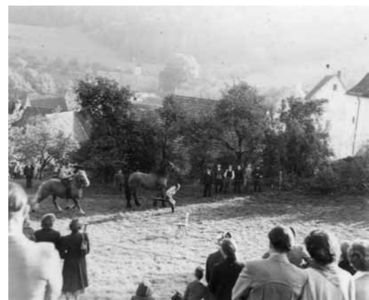
Reiten auf der Wiese hinter der Dorfkirche war einmal Freizeitvergnügen in Lausheim.

Die örtliche Mühle wurde 1935 pro forma stillgelegt, 1959 dann abgerissen. Bis in die 1960er Jahre hinein war in Lausheim traditionelles Handwerk ansässig: etwa Schmiede, Wagner und Schuster. Gehalten bis heute haben sich Schreiner und Zimmermann. Ja – es darf sogar gesagt werden, dass in Lausheim für seine Dorfgröße eine überdurchschnittlich große Gewerbeindustrie ansässig ist: Holzhandlung Baumann, Holzbau Gschwind, Schreinerei Günter Stritt, die Tiefbaufirma Heitzmann und Wenzel GmbH, Engel – Land- und Forsttechnik und die Firma Vogelbacher. Daneben ist der Ort geprägt von seinen Land- und Energiewirten. Gasthäuser haben im Ort eine lange Tradition. Eine eingemeißelte Jahreszahl verweist die Existenz des Hirschen bis auf 1515 zurück. Ein alter Kachelofen im Gasthaus Kranz datierte ins Jahr 1632. Der Kranz ist heute erstes Haus im Ort und bietet als Landgasthof Ferienwohnungen und einen Tagungs- und Gesellschaftsraum. Das näher an Grimmelshofen liegende Gasthaus »Zur Wutachschlucht« oder »Im Weiler«, wie es auch genannt wird, profitiert heute von den Wanderern, die dort in die Wutachflühen einsteigen, vom Museumsbahnbetrieb und von den Besuchern der Museumsmühle Blumegg-Weiler. Der Tourismus trägt nicht unwesentlich zum Erhalt der alten Gasthäuser bei.