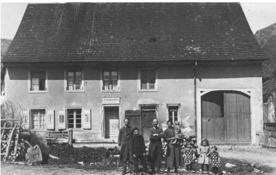
Schubhandlung Benedikt Scherble im Bachemers Haus