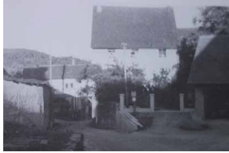
Pfarrhaus heute und einst vor dem Abriss des Pfarrgänge