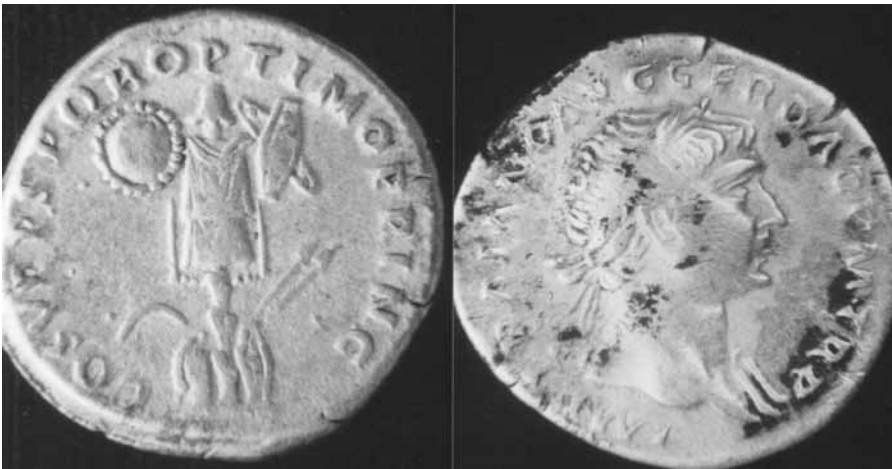
Münzfund aus der Zeit des römischen Kaisers Trajan (98–117 n. Chr.)

Wie in Stühlingen war in Lausheim ein Gutshof, eine villa rustica, situiert. Im Gewann »Fohrensachsen« weisen Luftbildaufnahmen auf Mauerreste und Schuttkegeln von Wohnhaus, Bad und Wirtschaftsgebäude hin. Solche Gutshöfe sind im Umfeld von Juliomagus (Schleitheim) mehrerenorts anzutreffen. Sie dienen unter anderem der Versorgung der nahe gelegenen römischen Kleinstadt. Münzen aus der Zeit des Kaiser Trajan (98–117 n. Chr.) und Ziegelreste bleiben