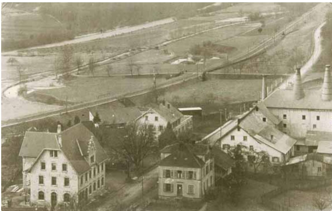
Rechts das alte Kalkwerk. Der Ehrenbach verläuft noch Richtung Stühlingen. Durch ein Hochwasser 1955 verschafft er sich einen direkteren Durchbruch zur Wutach.

1883 Anton Gäng stellt ein Gesuch, das ihm den Bau einer Portlandzementfabrik erlauben soll.