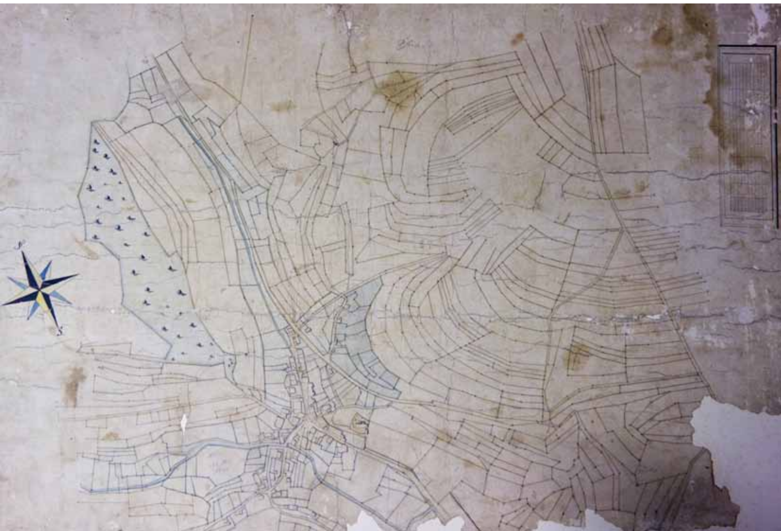
Flurkarte aus dem Zeitraum von 1816 bis 1824. Die Straße nach Schwaningen befindet sich noch nicht im Talgrund, sondern leicht versetzt am Hang.