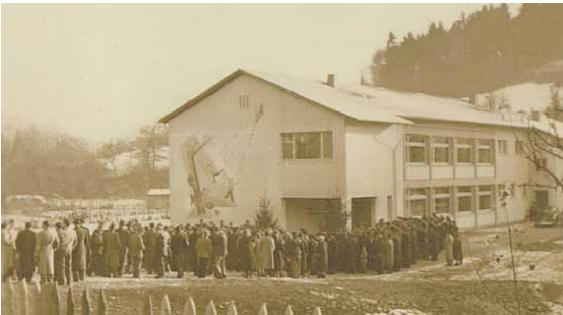
Festliche Schulhauseinweihung im Jahr 1955