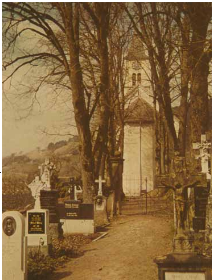
Friedhof vor der Veränderung im Jahr 1968