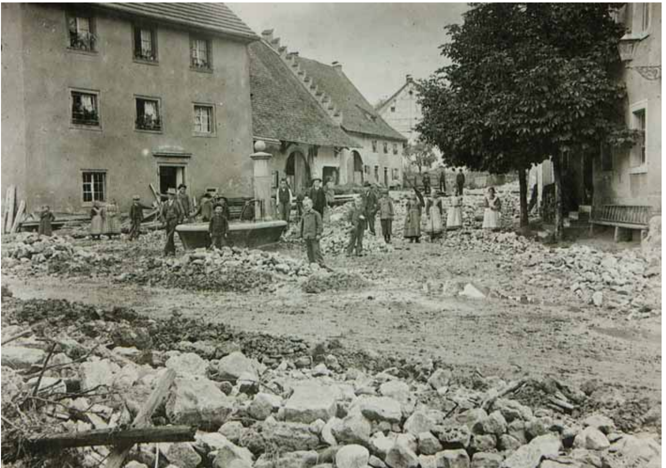
So sah das Dorfzentrum von Weizen am 29. Juni 1901 nach einem Wolkenbruch aus.