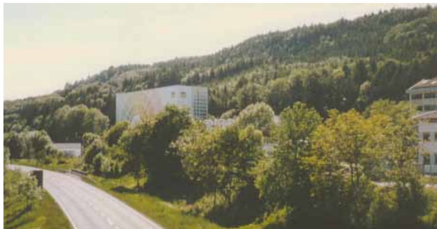
1993 wird das Logistikzentrum in Betrieb genommen.

1997 Einweihung des Kommunikationsgebäude (»das Schiff«) der Sto AG. Architekt ist Michael Wilford, London.