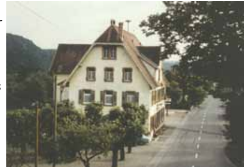
Gasthaus Sonne vor dem Umbau

1875 bittet Nepomuk Büche um Erlaubnis zur Errichtung einer Schankwirtschaft zum Kranz im Haus des Martin Geng hinten im Ort. Im April 1876 kauft er das heutige Gasthaus zum Kreuz – im Ort noch heute nach seinem ersten Besitzer »Muggli« genannt. Das »Kreuz« ist heute noch das einzige prosperierende Gasthaus in Weizen und weiterhin in der Hand der Familie.