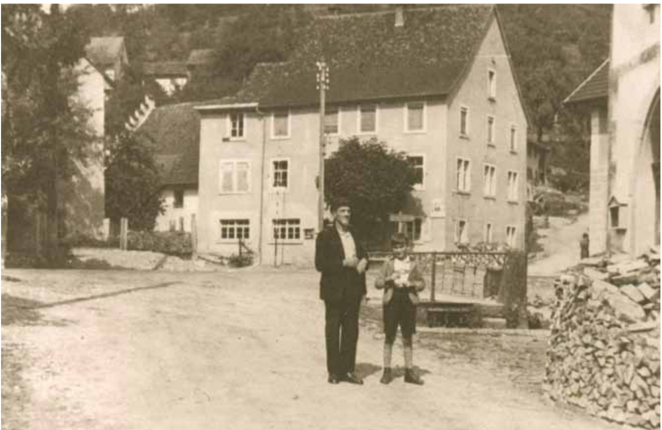
Blick vom alten Spritzenhaus aus zum Dorfplatz. In den 1950er Jahren aufgenommen.

1876 ist es 3-stöckiges Wohnhaus, Schul-, Rats- und Wachtzimmer sowie mit angebauter Scheuer und Stallung.