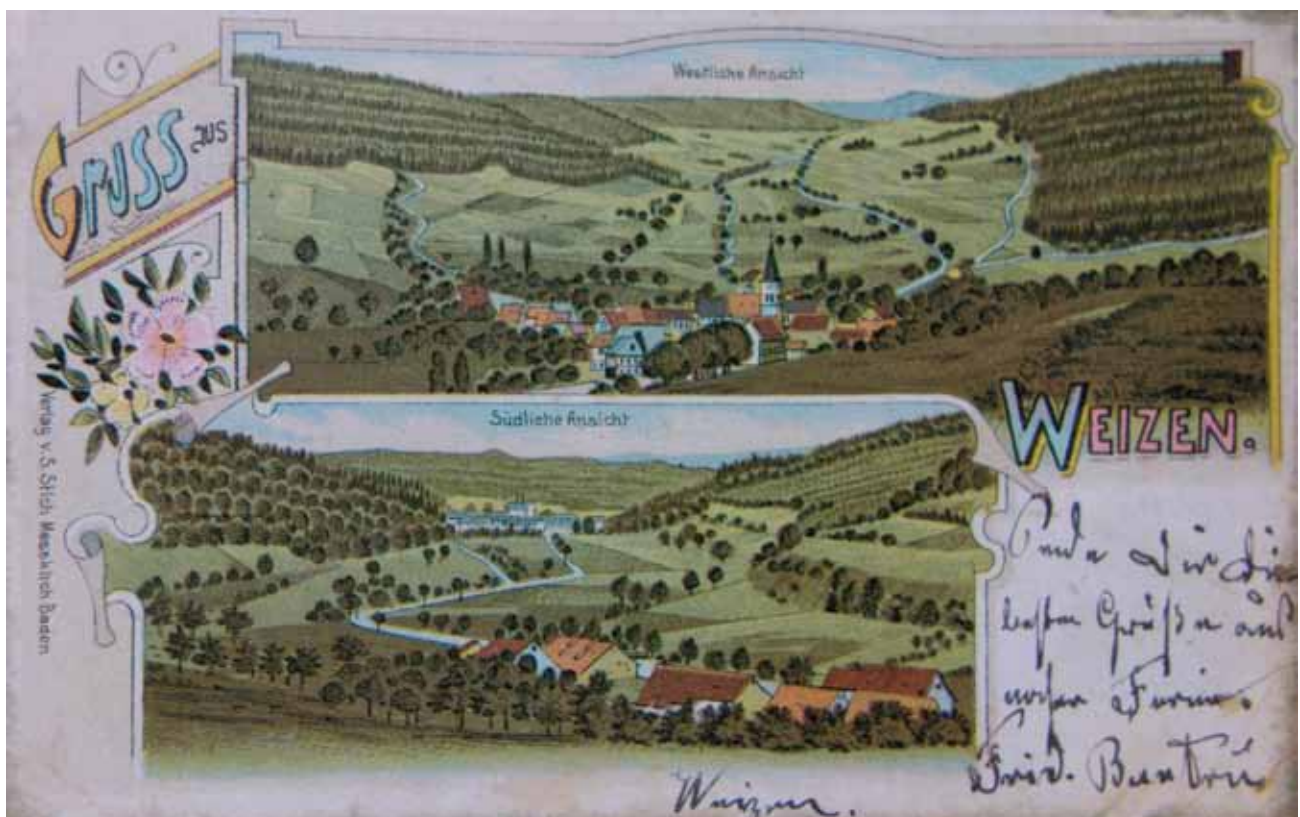
Die schöne Postkartenansicht zeigt Weizen in zwei Perspektiven vor 1910.

Das Ortswappen von Weizen: Ein goldener Kelch auf rotem Grund mit silberblauem Wolkenbord der ehemals fürstenbergischen Landeshoheit. Der Kelch erinnert an den Hl. Konrad, Bischof zu Konstanz (934 bis 975) und Schutzpatron der 1838 erbauten Kirche zu Weizen.