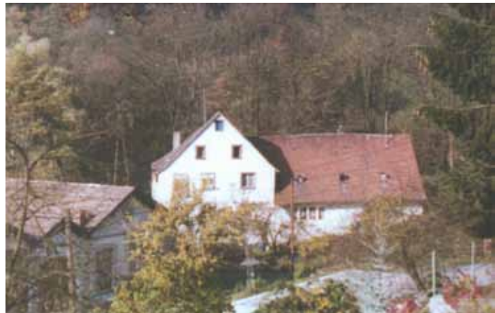
Alte Mühle, die 1979 abgebrochen wurde.