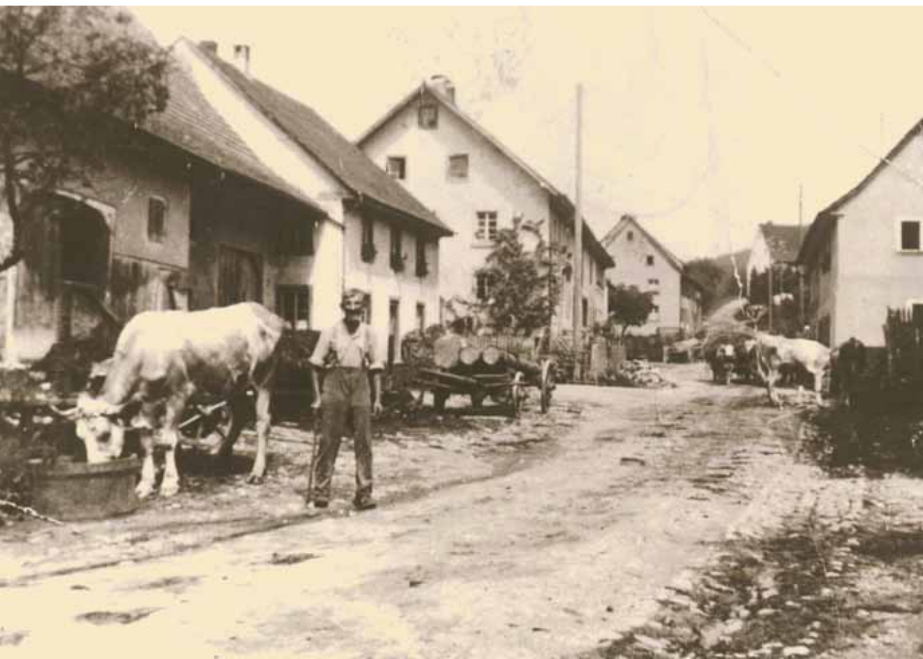
Lausheimer- straße in den 1930er Jahren