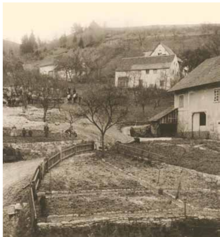
Teilansicht vom Sonnenbuck, Feb. 1947.