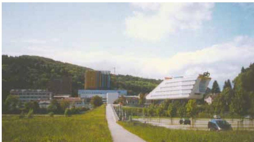
1997 wird das Kommunikationszentrum eingeweiht.