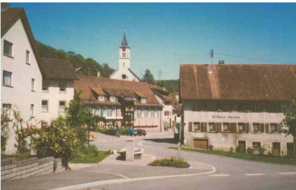
Ortszentrum, aufgenommen 2007