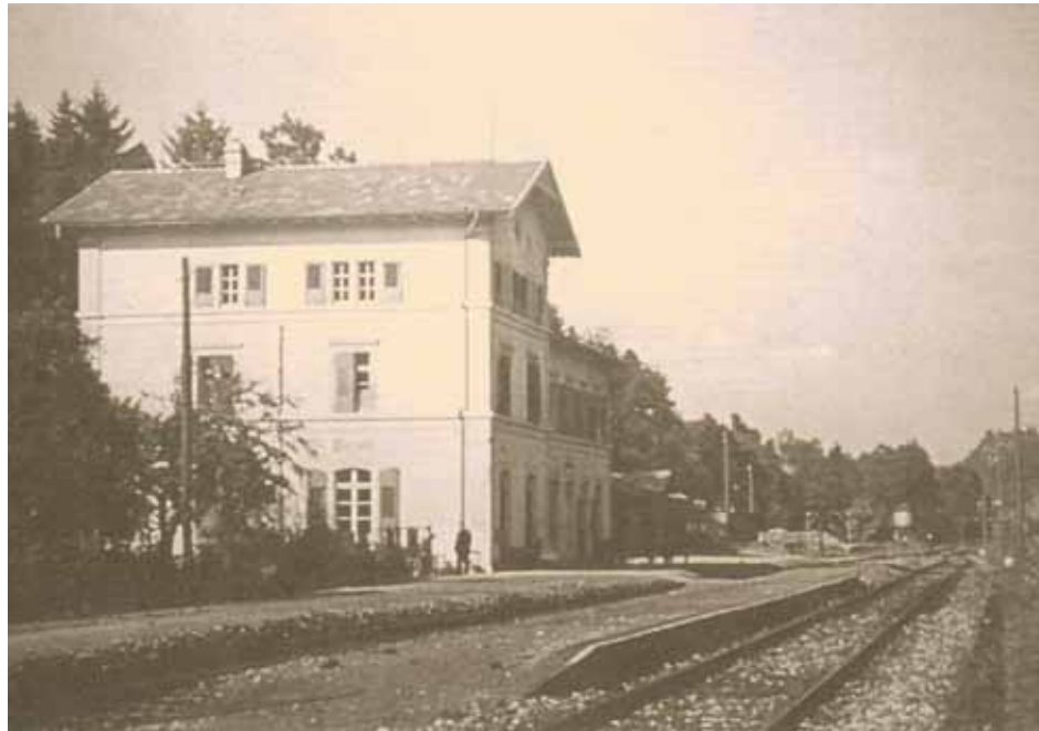
Das alte, baufällig gewordene Bahnhofsgebäude wurde in den 1970er Jahren abgerissen.