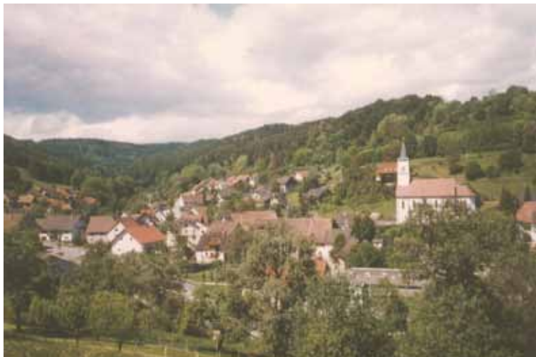
Ansichten von Weizen um 2000. Das Vereinsheim steht bereits.