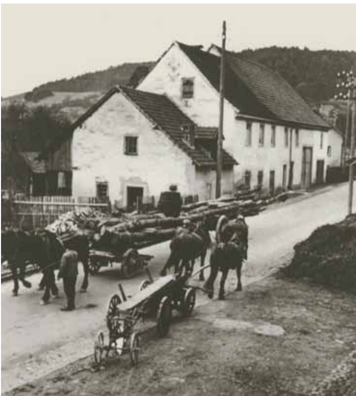
Das Unterdorf von Weizen, undatiert.

Im Jahr 1353 hören wir von einer Mühle im Unterdorf (Schnidermärtli), eben falls im Besitz von St. Blasien. (»uf der múli gelegen ze Witzen, die gehöret in das kein ampt des gochzuses von sant Blesien«). Der Ort gehört zu dieser Zeit zu der Landgrafschaft Stühlingen.