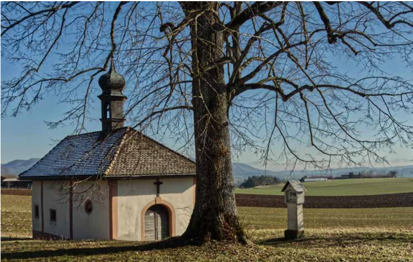
Die Kalvarienbergkapelle im Februa 2020. Im Hintergrund die Alpen. Vielleicht auch ein Grund für den Standort. Denn gefühlt ist der Gläubige durch die Berge dem Himmel näher, wie viele Gipfelbücher bekunden.