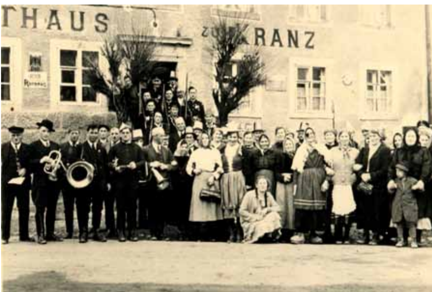
Alte Dorfansichten und Impressionen des Dorflebens. Teilweise sind die Häuser abgerissen. Zu sehen ist noch die Wasserleitung der Mühle sowie das alte Waaghüsli.