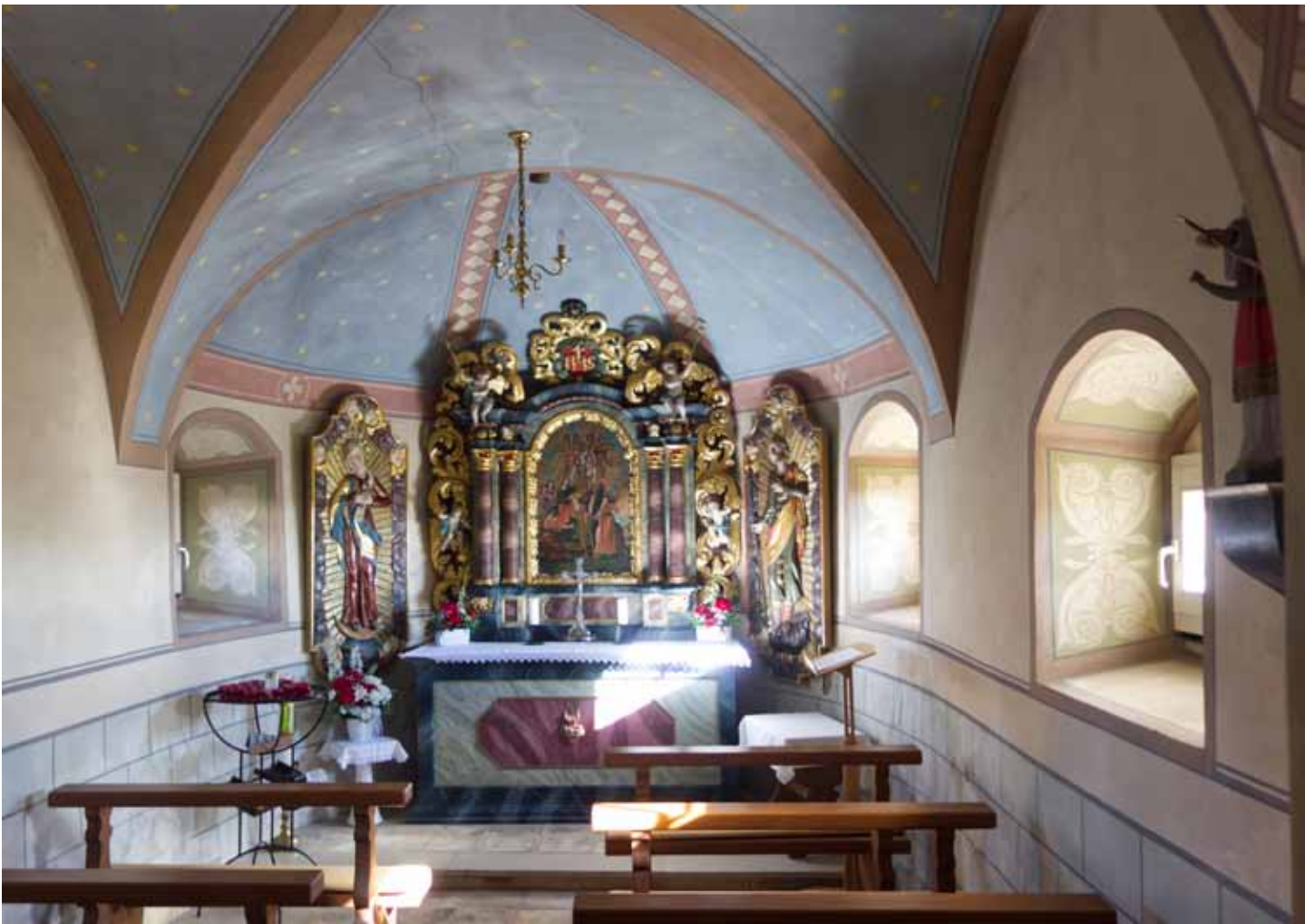
Die Inneneinrichtung Februar 2020 mit ursprünglichem Altarensemble.

Stauffenberg erlaubt, den Grundstein zu legen. Am 20. Oktober 1726 wurde die Kapelle feierlich eingeweiht. Im Jahr 1731 betrug das Vermögen der Stiftung 827 Gulden, eine beträchtliche Summe zu jener Zeit. Sie ermöglichte u. a. die Pfarrei in Weizen wieder zu beleben.