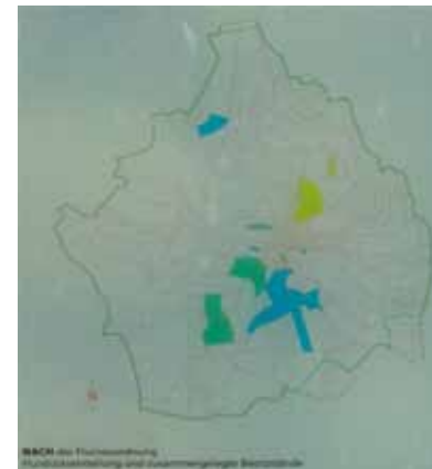
Aus der Infotafel über die Flurneuordnung auf dem Franz-Kehl-Platz