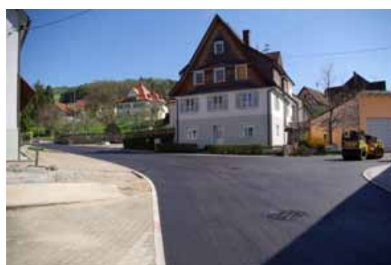
Bilder aus der Zeit der Ortssanierung. Zahlreiches weiteres Bildmaterial unter » http://www.schwaningen-geschichte.de «