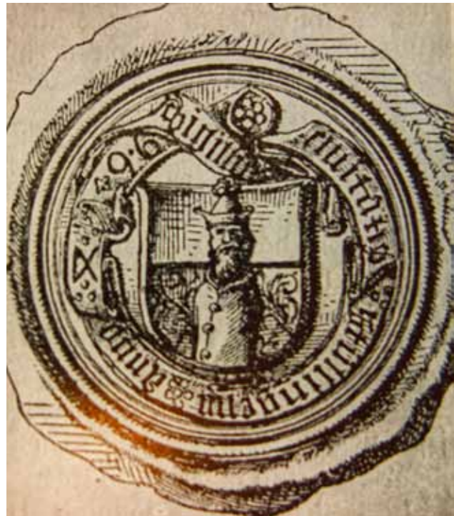
Mit diesem Siegel der Stadt Stühlingen 1497 wurde der Pfändungsvertrag vom 26. Juni besiegelt.