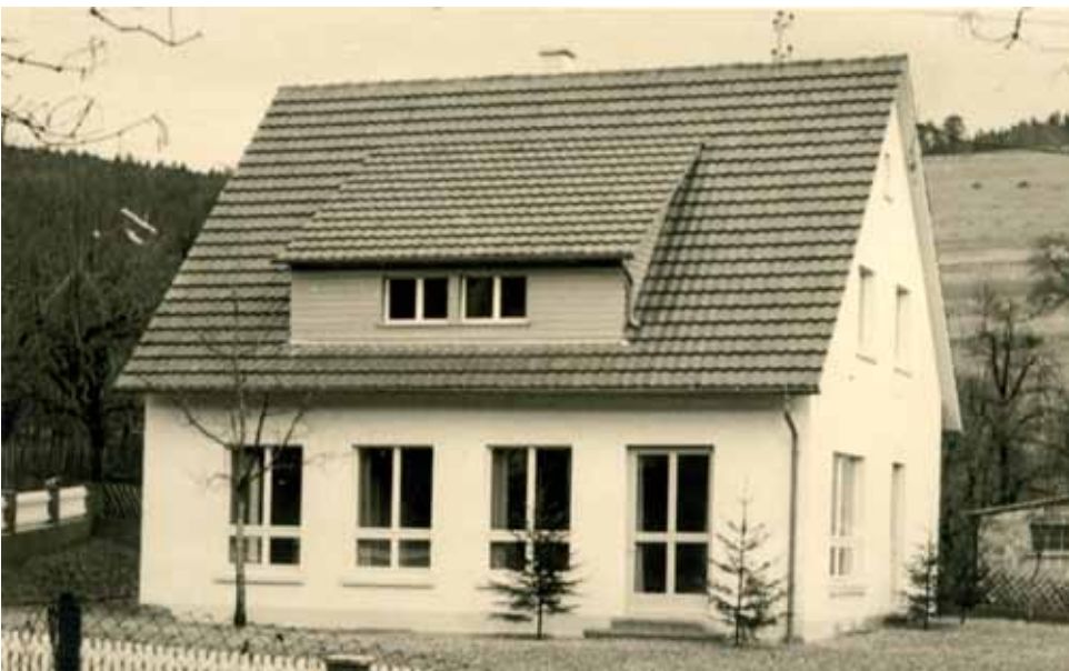
Gebäude in der Talstraße, das ab 1955 bis 1996 den Kindergarten beherbergte.