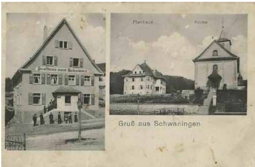
Postkartenansicht von Schwaningen. Datum unbekannt.