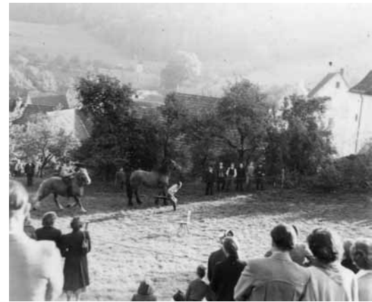
Reiten auf der Wiese hinter der Dorfkirche war einmal Freizeitvergnügen in Lausheim.

Die örtliche Mühle wurde 1935 pro forma stillgelegt, 1959 dann abgerissen. Bis in die 1960er Jahre hinein war in Lausheim traditionelles Handwerk ansässig: etwa Schmiede, Wagner und Schuster. Gehalten bis heute haben sich Schreiner und Zimmermann. Ja – es darf sogar gesagt werden, dass in Lausheim für seine Dorfgröße eine überdurchschnittlich große Gewerbeindustrie ansässig ist: Holzhandlung Baumann, Holzbau Gschwind, Schreinerei Günter Stritt, die Tiefbaufirma Heitzmann und Wenzel GmbH, Engel – Land- und Forsttechnik und die Firma Vogelbacher. Daneben ist der Ort geprägt von seinen Land- und Energiewirten. Gasthäuser haben im Ort eine lange Tradition. Eine eingemeißelte Jahreszahl verweist die Existenz des Hirschen bis auf 1515 zurück. Ein alter Kachelofen im Gasthaus Kranz datierte ins Jahr 1632. Der Kranz ist heute erstes Haus im Ort und bietet als Landgasthof Ferienwohnungen und einen Tagungs- und Gesellschaftsraum. Das näher an Grimmelshofen liegende Gasthaus »Zur Wutachschlucht« oder »Im Weiler«, wie es auch genannt wird, profitiert heute von den Wanderern, die dort in die Wutachflühen einsteigen, vom Museumsbahnbetrieb und von den Besuchern der Museumsmühle Blumegg-Weiler. Der Tourismus trägt nicht unwesentlich zum Erhalt der alten Gasthäuser bei.