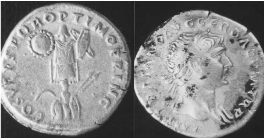
Münzfund aus der Zeit des römischen Kaisers Trajan (98–117 n. Chr.)

Wie in Stühlingen war in Lausheim ein Gutshof, eine villa rustica, situiert. Im Gewann »Fohrensachsen« weisen Luftbildaufnahmen auf Mauerreste und Schuttkegeln von Wohnhaus, Bad und Wirtschaftsgebäude hin. Solche Gutshöfe sind im Umfeld von Juliomagus (Schleitheim) mehrerenorts anzutreffen. Sie dienen unter anderem der Versorgung der nahe gelegenen römischen Kleinstadt. Münzen aus der Zeit des Kaiser Trajan (98–117 n. Chr.) und Ziegelreste bleiben