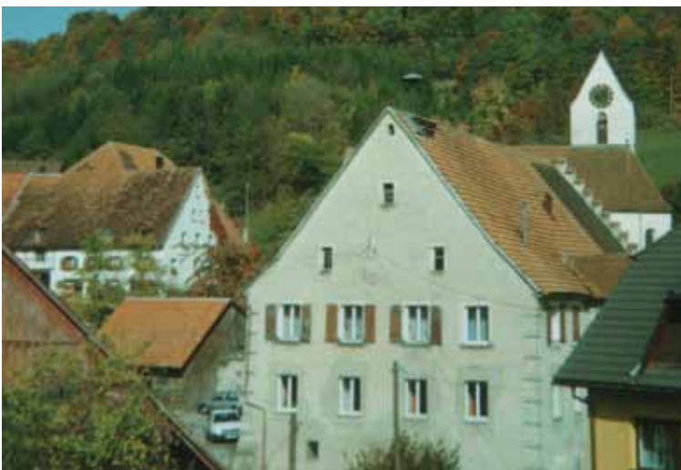
Das stattliche Haus mit seinem Stufen- giebel fungierte als Rathaus und Schule. Indizien weisen darauf hin, dass es auch das Pilgerhaus zu Zeiten der Wallfahrten war.

Die Kirche St. Nikolaus ist neben seinem Alter aus zwei Gründen von Interesse: kunsthistorisch aufgrund umfangreich erhaltener manieristischer Ausschmückungen aus dem frühen 17. Jahrhundert, die in dieser Weise selten anzutreffen sind, und sozialgeschichtlich, da sie ehemals Wallfahrtskirche war, in der Geistes- kranke Heilung erhofften. 1574 soll ein Messgewand des hl. Nikolaus nach Lausheim gekommen sein. Es heißt, dass jahrhundertlang »wahnsinnige, hirnwütige, unsinnige« Kranke nach Lausheim gebracht wurden. Dort wurden sie mit dem Messgewand bedeckt und durch Anrufung des hl. Nikolaus wurde Heilung oder Linderung erhofft. Die Geschichte dieser Wallfahrten währte mit Unterbre- chung im 30jährigen Krieg rund ein Vierteljahrtausend. Im Jahr 1839 stellte ein Gutachter fest: »Da aber nunmehr durch geistliche und weltliche Einschreitung dieser Unfug seit längeren Jahren abgethan ist [...], das Wundergewand beiseitege- schafft, und hiermit das Zulaufen und die Wunderheilung der Irren, als auch ihre Verpflegung von Seiten des Mesmers wegfällt, so fällt auch die für diesen Dienst gewährte Belohnung [...] für die Zukunft weg.« Das Pilgerhaus soll ein »Haus zwischen Pfarrhof und der Ortsrandstraße« gewesen sein.